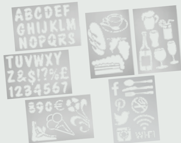
6 10 60 SECSTN-5 | 32x22x0,05cm | 0,1kg