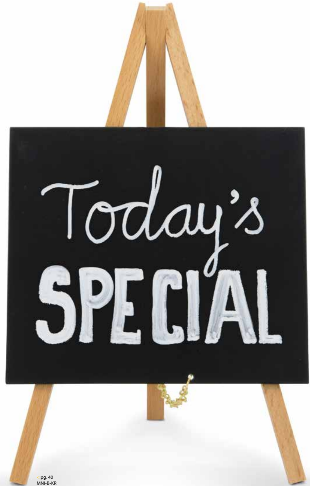
pg. 40 MNI-B-KR