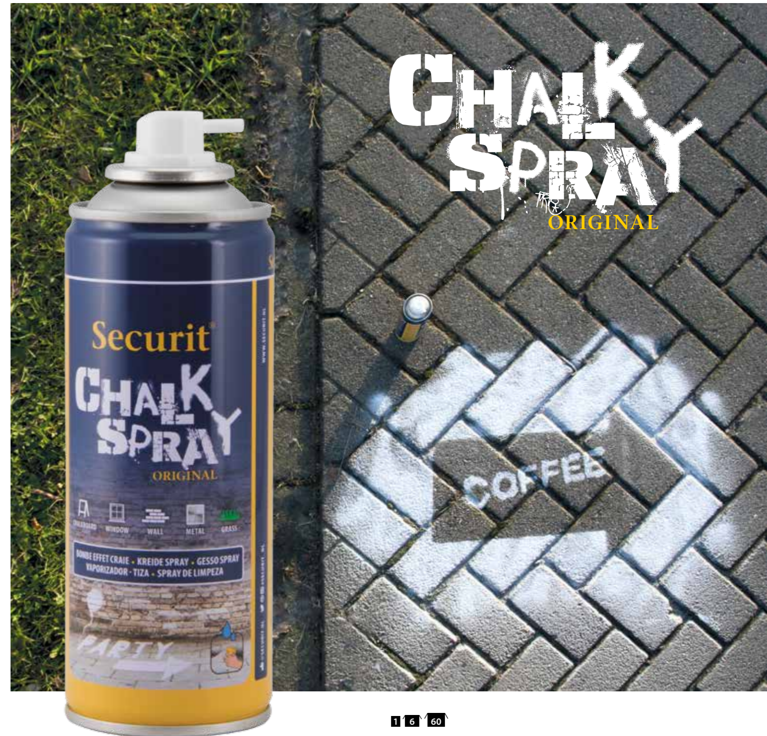
1 6 60 SMA200-WT | 17x5x5cm | 200ml

Water-based chalk spray, suitable for all surfaces, easy to clean with water. Simply shake and press to spray, allow drying, then wipe clean with a sponge and water. Best suitable for floor stencils and writing.