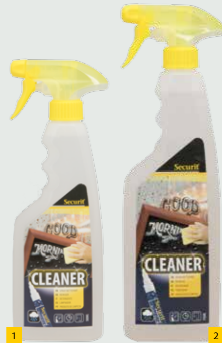
1 12 1 SECLEAN-KL | 27x8,7x4,8cm | 0,5kg | 500ml 2 SECLEAN-GR | 32x8,7x6,4cm | 0,8kg | 750ml