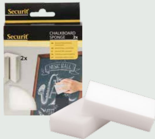
2 12 SPONGE-2 | 2,5x6x10,5cm | 0,03kg